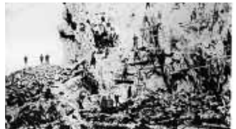
昭和20年代 道遊の割戸採掘風景 崖に木材で足場を組んで鉱石を採掘している様子が見えます

明治10年代に書いた「佐渡鉱山道遊坑の記」に、道遊は鉱脈が極めて硬く、金銀が少ないこと、斜面が急で下向きや上向きの階段掘りが難しいことなどもあり、採掘を試みたものの採算が取れなかったと書かれています。このため、山が切り崩されることも無く、佐渡金山のシンボルともいえるべき見事な山容が後世に残されることになり、平成6年(1994)5月24日、国の史跡に指定されました。また、その風光明媚な姿は、相川八景の道遊秋月として多くの詩歌にも詠まれ、山麓には、昔の坑道を再利用した相川測候所の地震計や近代の佐渡鉱山発展に尽力した大島高任を祀った高任神社などが残されています。