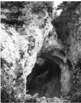
間近で見た道遊の割戸 左右の壁面にも無数の坑道が掘られています

道遊の割戸は、頂上部分で海拔252メートル、山麓から132メートル、割れ目の部分の大きさは、最大幅30メートル、深さ74メートルもあり、これほどの規模を持つものは国内では見ることができません。また、割戸がある道遊脈とよばれる金銀脈は、高任堅坑から東にのび、稼業延長120メートル、稼業深度150メートル、平均脈幅10メートルもあり、佐渡の鉱床のなかでも大きな部類に入ります。また、鉱脈中には金銀が1対10の割合で含まれ、金含有量が