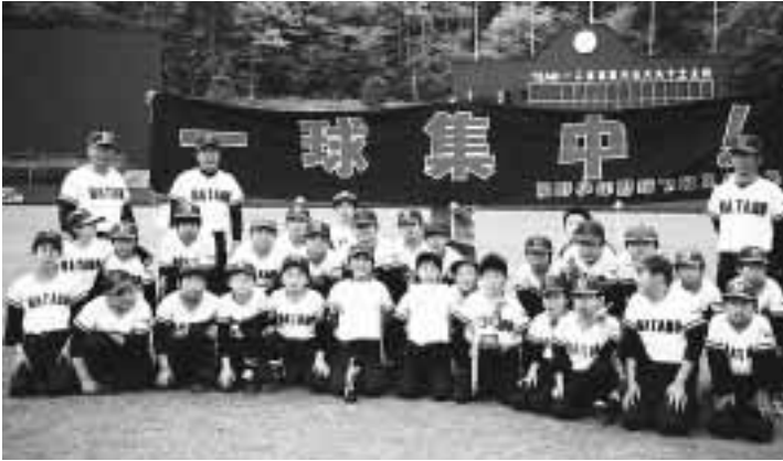
畑野プロスパース