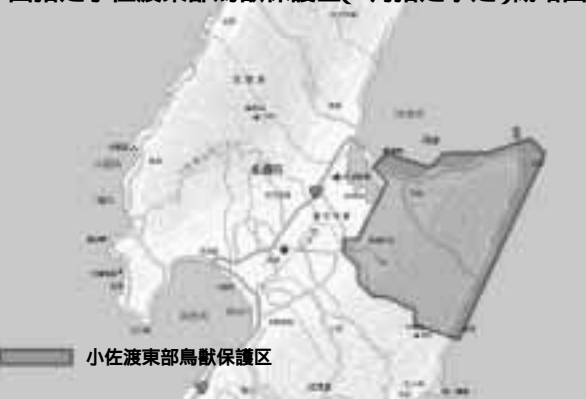
国指定小佐渡東部鳥獣保護区(7月指定予定)概略図